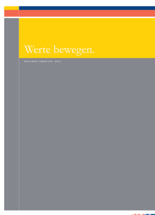
SAF-HOLLAND S.A. Geschäftsbericht 2007

Eine weitere Chance zur positiven Meinungsbildung am Kapitalmarkt: Unternehmen sollten ihre Wettbewerbssituation genau beschreiben, etwa um ihre führende („best-in-class“) oder zumindest sehr gute Position hervorzuheben. Von Marktführern und Unternehmen mit einer starken Positionierung wird allgemein erwartet, dass sich diese am ehesten in einer Markt- oder Branchenkonsolidierung behaupten werden. Dies er-