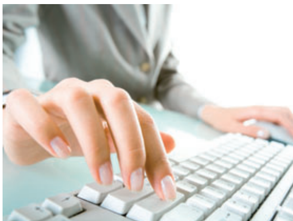
Idealerweise arbeiten die Anwender eines Redaktionssystems mit Standard-Software, die sie aus der täglichen Arbeit schon kennen, beispielsweise Word oder Excel.