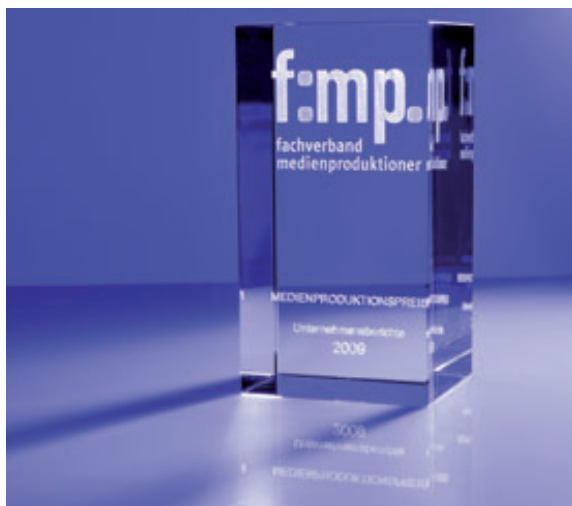
Medienproduktionspreis des f.mp., der 2009 erstmals verliehen wurde